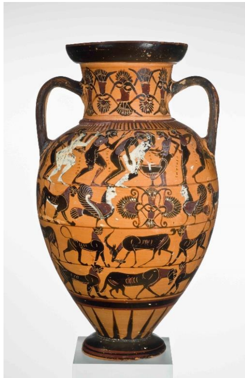
Das Symposion läuft aus dem Ruder. Attisch schwarzfigurige Amphore, Ton, 560–550 v. Chr. Staatliche Antikensammlungen München, Inv. SH 1432

Staatlichen Antikensammlungen in München ermöglichen einen direkten Blick in die Antike, wenn auch meist durch eine männliche Brille.