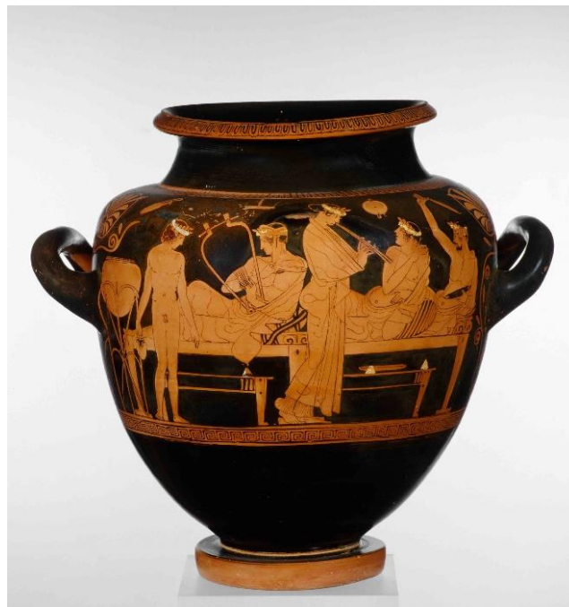
Das Idealbild eines gesitteten Symposions. Attisch rotfiguriges Weinmischgefäß, Ton, um 430 v. Chr. Staatliche Antikensammlungen München, Inv. SH 2410